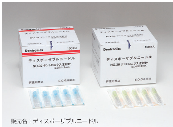
販売名：ディスプレイザブルニードル