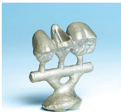
ホンダ デンタル ラボラトリー (東京都開業)