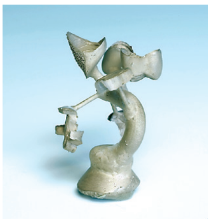
パラ デンタル システム ホルス (郡山市開業)