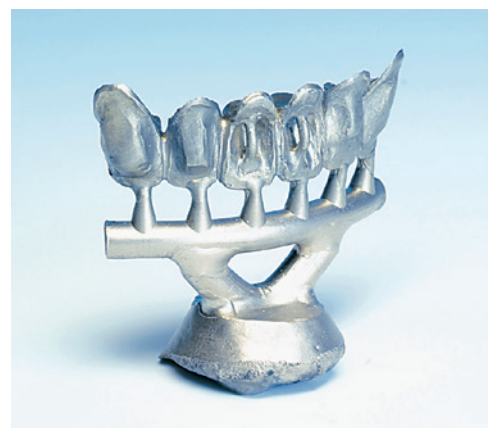
ティーズテクニカルスタジオ有限公司 (東京都開業)