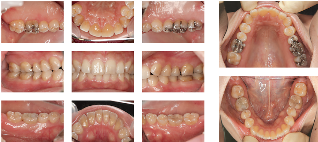
Lサイズを使って45秒で撮影した9枚法写真 (製品付属のDVDに動画を収録)