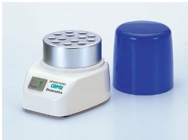
●歯科材料加湿器 ●一般医療機器 ●医療機器届出番号13B2X00051211201

カートリッジ麻酔液を、痛みの少ないと言われる37℃に温め、保温します。33G/31G注射針とともに、カートリーエース・プロの価値を高めます。